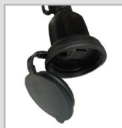
キャップ付 防水コンセント