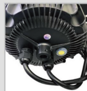
本体防水スイッチ付